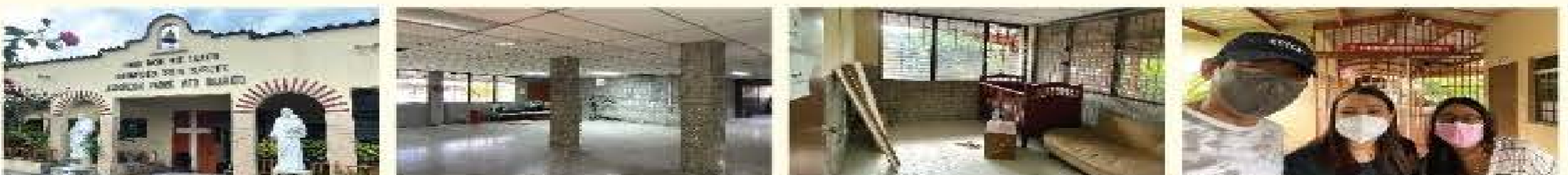
▲ 엘살바도르 뇌성마비 고아시설 현장사진입니다.

※ 판매 수익금 전액은 엘살바도르 뇌성마비 고아시설 개선 사업에 사용됩니다.