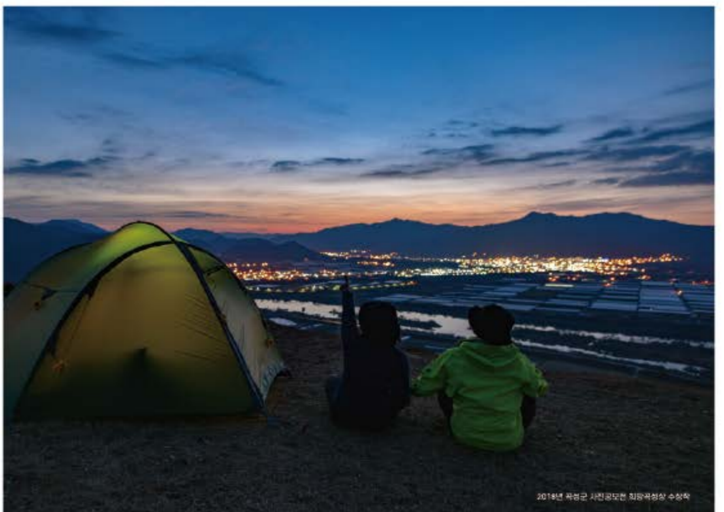
2019년 곡성군 사진공모전 최우수상 수상작