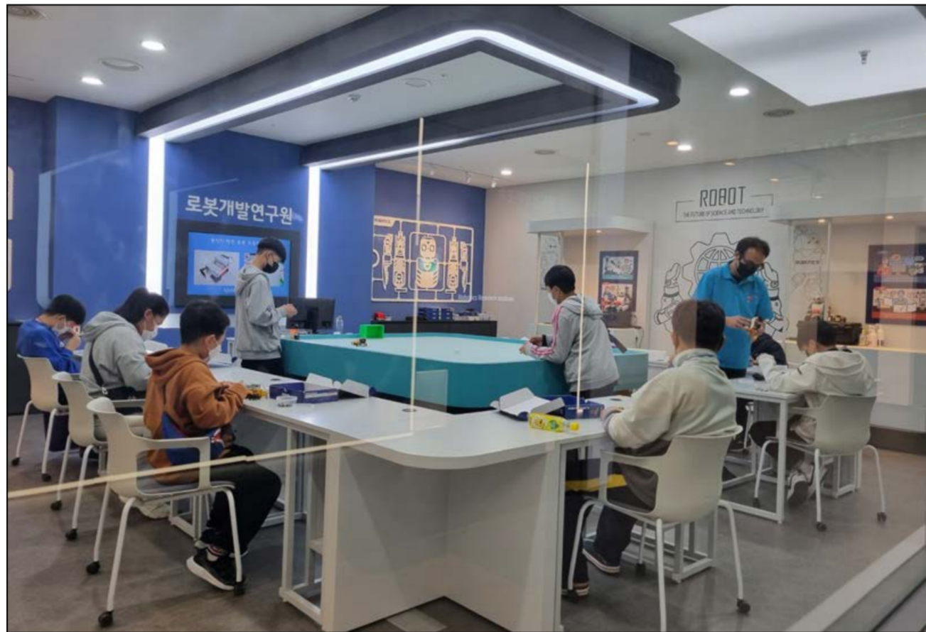
화순군(군수 구복규) 드림스타트가 최근 초등학교 아동 33명을 대상으로 순천만잡월드에서 진로·직업 프로그램을 체험했다. 이번 프로그램은 다양한 직업 세계에 대한 이해도를 제고하고 지역 아동들의 적성에 맞는 올바른 진로선택에 도움을 주기 위해 마련됐다.

군 관계자는 "성공적인 국정 운영을 뒷받침할 수 있도록 공직자들의 정책기획 능력을 지속적으로 향상시키기 위해 노력하겠다"고 말했다. /장진성 기자