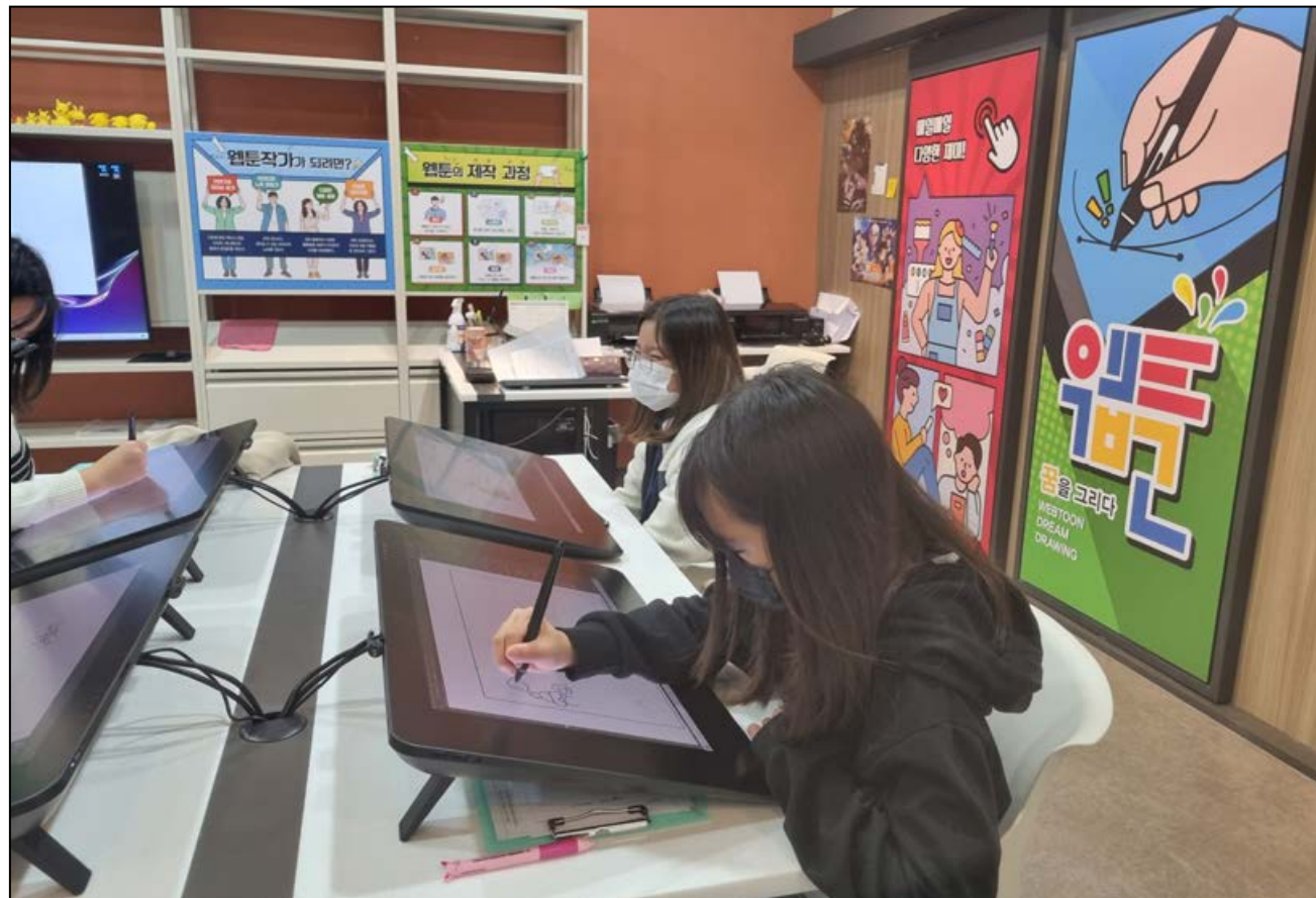
화순군(군수 구복규) 드림스타트가 최근 초등학교 아동 33명을 대상으로 순천만잡월드에서 진로·직업 프로그램을 체험했다. 이번 프로그램은 다양한 직업 세계에 대한 이해도를 제고하고 지역 아동들의 적성에 맞는 올바른 진로선택에 도움을 주기 위해 마련됐다.

군 관계자는 "성공적인 국정 운영을 뒷받침할 수 있도록 공직자들의 정책기획 능력을 지속적으로 향상시키기 위해 노력하겠다"고 말했다. /장진성 기자