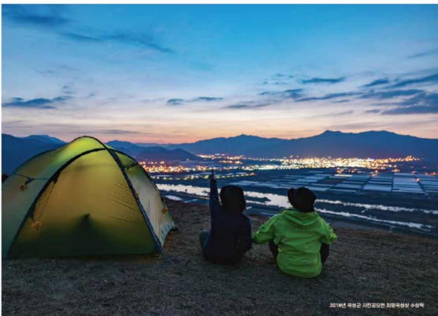
2017년 곡성군 자연공도한 최명관영양 수상작