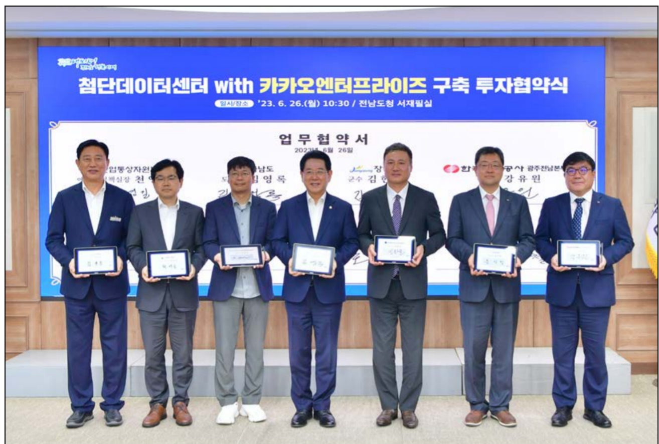
장성군은 최근 전남도청에서 산업통상자원부, 전남도, 한국전력공사, (주)카카오엔터프라이즈, 파인애플파트너스자산운용(주), KB증권(주)와 함께 데이터 센터 설립 투자협약을 체결했다.