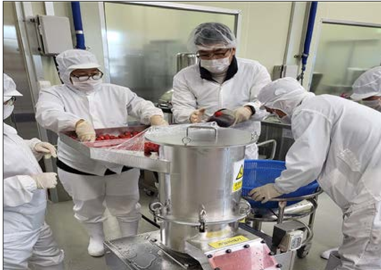
해남군은 지난 2019년 농업인들의 가공 창업활동을 지원하기 위해 마산면 식품특화단지내에 농산물종합가공지원센터를 개소하고, 농가의 농산물 가공창업을 위한 기술교육과 현장 자문을 실시하고 있다.

군 관계자는 "농산물종합가공지원센터 효율적인 운영으로 로컬컬거리의 허브가 되도록 최선을 다하겠다"고 말했다. /윤보현 기자