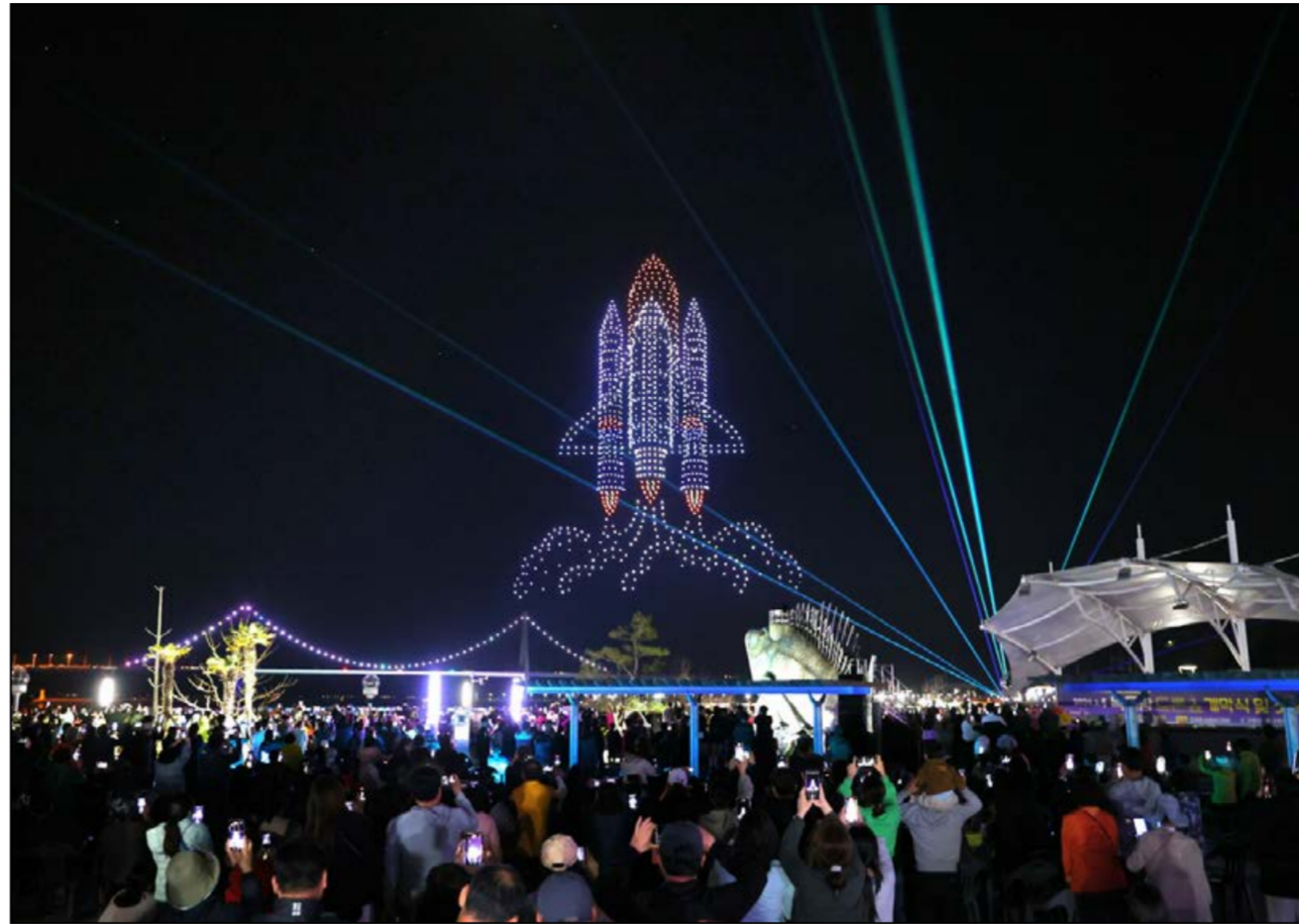
고흥군(군수 공영민)이 지난 4월 13일 첫 개막한 녹동항 드론쇼 화려한 1500대 스페셜 공연에 1만여 명의 관람객들이 참여한 가운데 고흥의 또 다른 매력과 활기 넘치는 밤거리 풍경을 소개해 전국적인 이목과 집중을 받으면서 흥행 열풍을 예고하고 있다.

도가 매우 높다. 녹동항 드론쇼는 오는 11월까지 8개월간 매주 토요일 저녁 9시마다 소록대교 야경을 배경 삼아 드론 700대 규모 이상으로 펼쳐진다. 공연 시간은 하절기(4~9월)는 저녁 9시, 동절기(10~11월)는 저녁 8시 단 한 차례 진행되며, 공연은 특정한 장소 없이 녹동항 어디서든 공연 관람이 가능하다. 여기에 더해 군은 특별한 시기인 추석과 설 명절, 고흥유자축제, 연말연시 기간 중에 1천대 이상 특별 공연도 운영해 나갈 계획이다. 고흥군은 매 주말 드론쇼 공연 외에도 지역 가수가 참여하는 버스킹 공연, 불꽃쇼, 상용 드론 비행시연, 야간 해상 레이저쇼, 소록대교 경관 조명쇼 등 다양한 볼거리는 물론 녹동항 일원에 먹거리, 즐길거리 체류형 콘텐츠 확대를 위해 고흥 야간관광의 활력을 높이는 데 주력해 나갈 방침이다. /최종민 기자