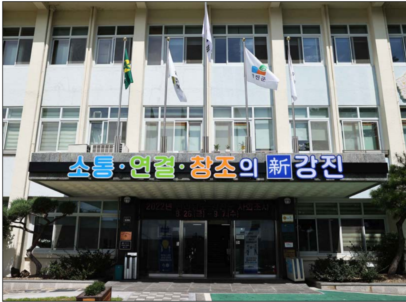
강진군청 전경 사진

또한 소나무류를 이동하려면 반드시 생산확인표 또는 재선충병 미감염 확인증 등을 발급받아야 하며, 이를 위반해 무단 이동하거나 감염목을 취급할 경우 「소나무재선충병 방제특별법」에 따라 벌금 등 행정처분을 받을 수 있다. 강진군 관계자는 “소나무재선충병은 사람에게 의한 감염목 이동이 가장 큰 확산 요인 중 하나인 만큼 목재취급업체 등의 철저한 관리가 중요하다”며 “강력한 단속과 지속적인 예방 활동으로 재선충병 확산 방지에 최선을 다하겠다”고 말했다. /박종욱 기자