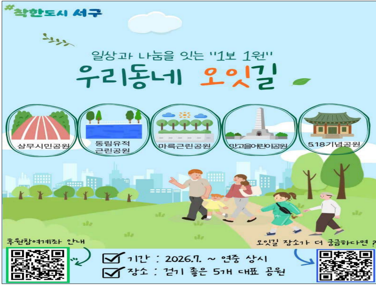
우리동네 오잇길 포스터