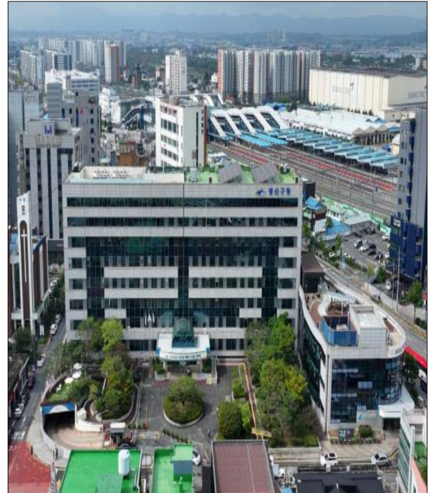
광주 광산구청 전경 사진