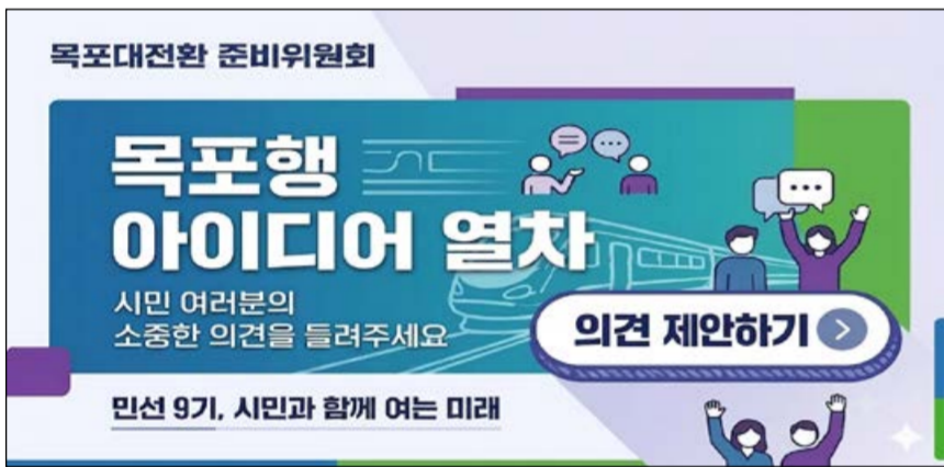
목포행 아이디어 열차 배너 사진