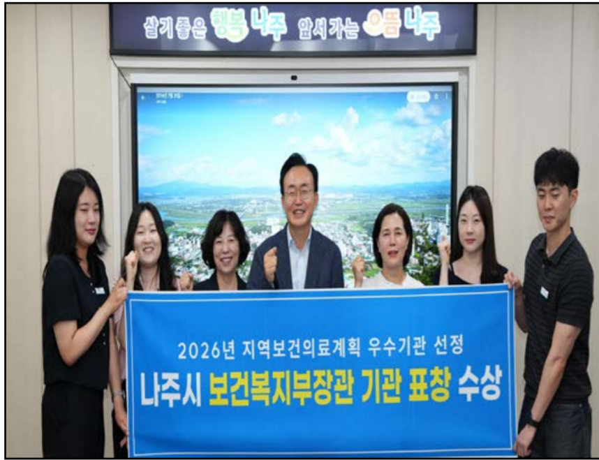
보건복지부 표창 수상 기념사진